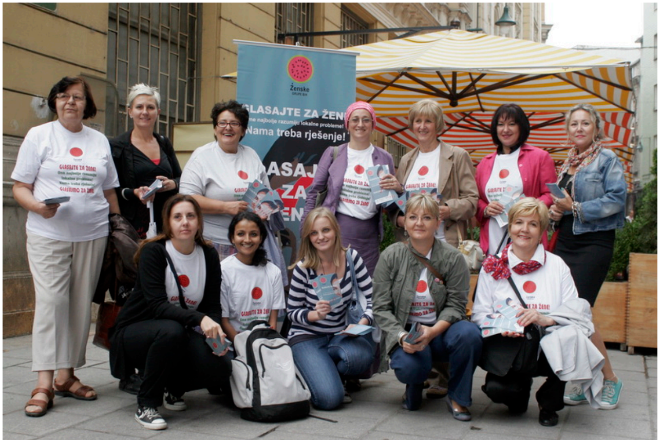
Ulična akcija Sarajevo, septembar, 2012.

Neposredno pred početak predizborne kampanje, širom Bosne i Hercegovine u brojnim gradovima organizirane su ulične akcije u okviru kampanje «Glasajmo za žene». U direktnom kontaktu sa glasačima i glasačicama aktivistkinje partnerskih organizacija su predstavljale i kampanju, ali i kandidatkinje raznih političkih stranaka. Građanima i građankama su distribuirani promotivni materijali sa informacijama o kampanji.