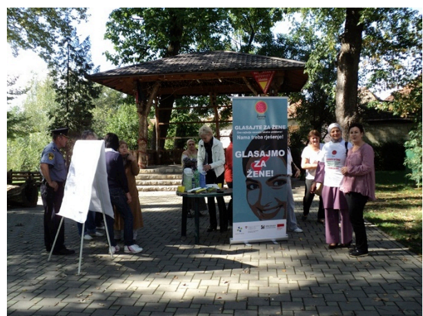
Detalj sa ulične akcije, oktobar, 2012., Krajiška suza Sanski Most