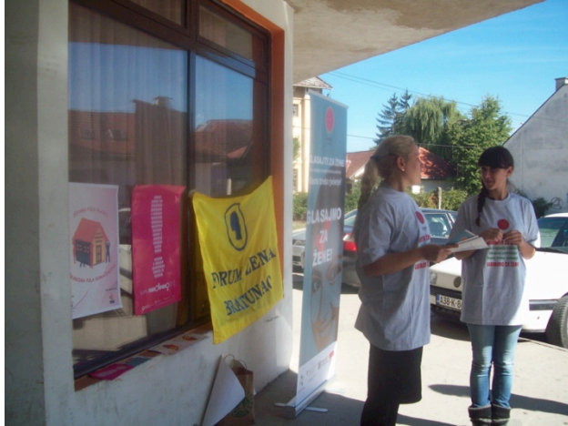
Detalj sa ulične akcije, Forum žena Bratunac, oktobar, 2012.