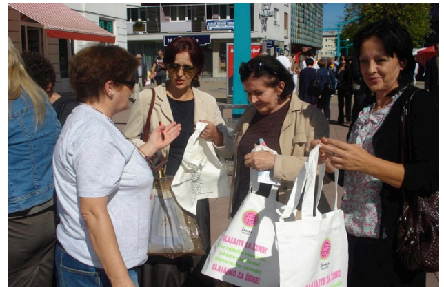
Detalj sa ulične akcije, oktobar, 2012, Glas žene, Bihac